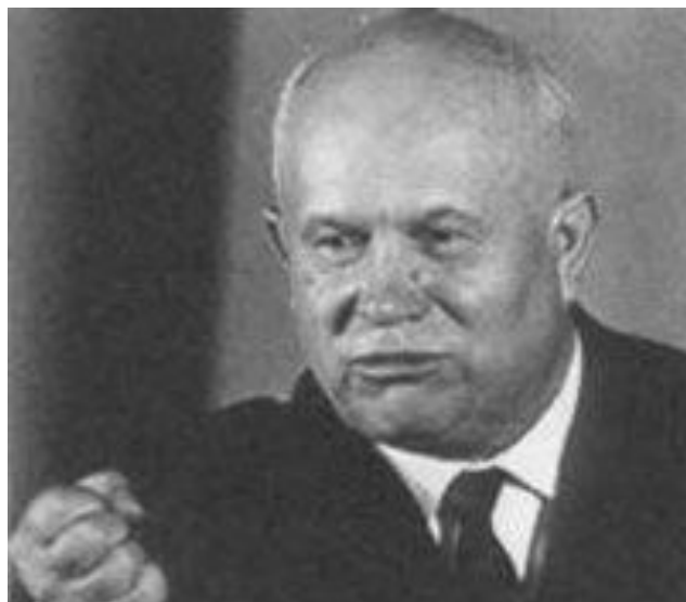
Усиление позиций Хрущева – ослабление Маленкова.