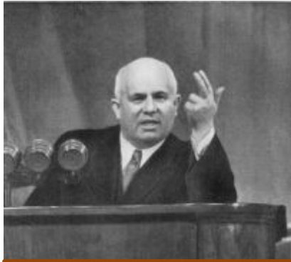
Первый секретарь ЦК КПСС

Один из виновников «Ленинградского дела»