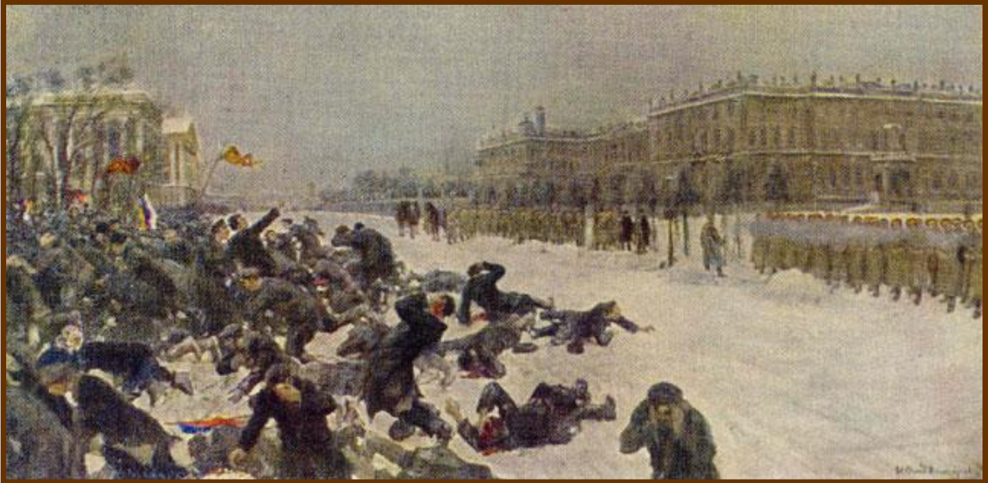
Владимиров И. «Расстрел рабочих у Зимнего дворца»