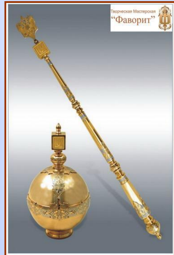
Скипетр и держава