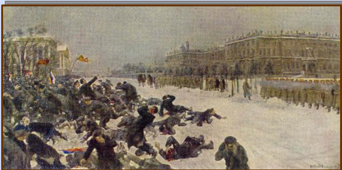
Владимиров И. «Расстрел рабочих у Зимнего дворца»