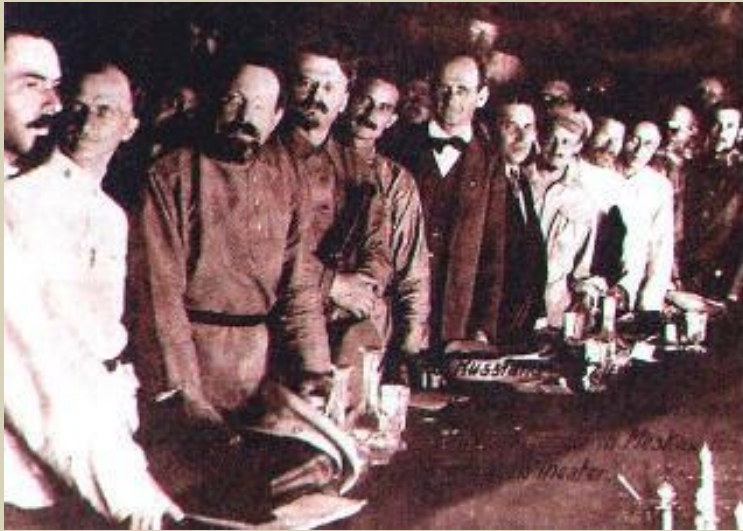
Л.Троцкий на II конгрессе Коминтерна

В 1914-15гг. распался II интернационал В результате распада образовались два независимых объединения социалистических партий разной направленности: