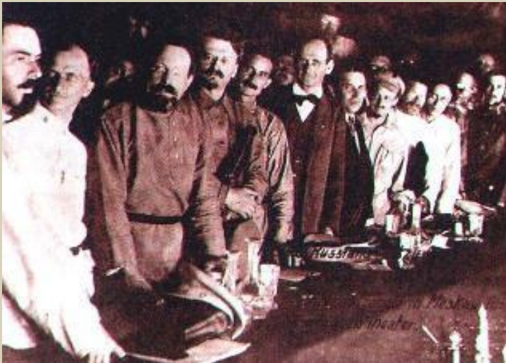
Л.Троцкий на II конгрессе Коминтерна