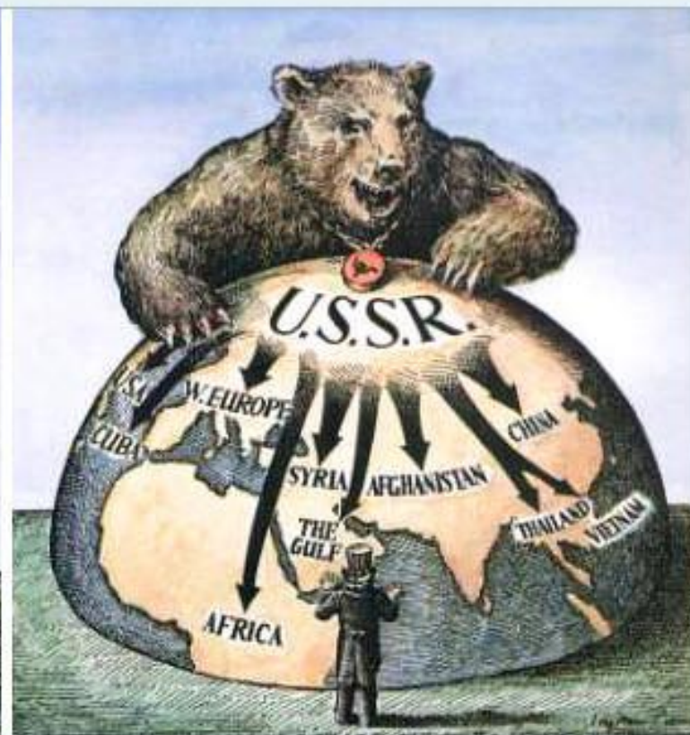
Карикатура на тему Холодной войны