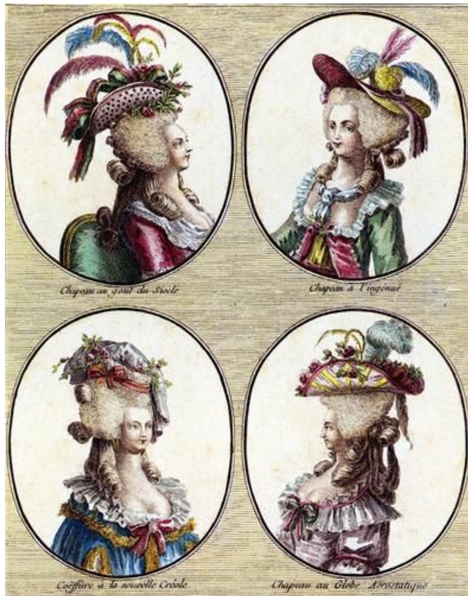
Chapeau au goût des Proles