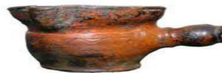
ГОРШОК ДЛЯ ТОПЛЕНИЯ МАСЛА