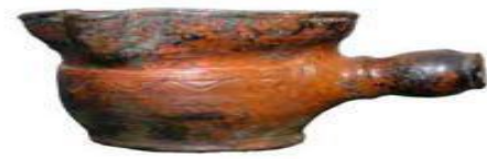
ГОРШОК ДЛЯ ТОПЛЕНИЯ МАСЛА