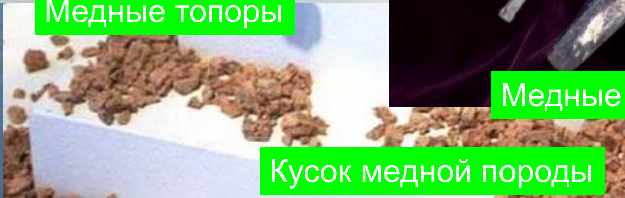
Кусок медной породы