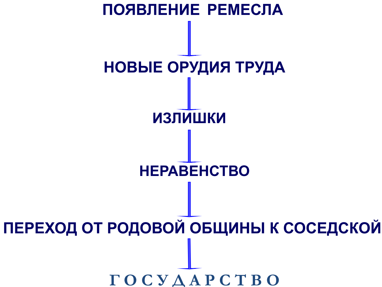
СХЕМА ЗАРОЖДЕНИЯ ГОСУДАРСТВА