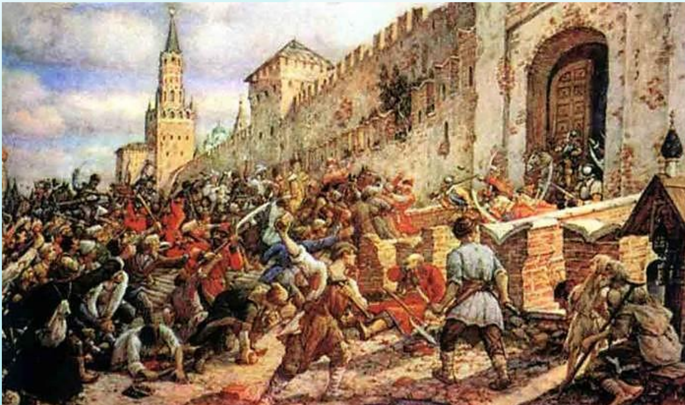
Соляной бунт в Москве 1648. Картина Э. Лиснера, 1938