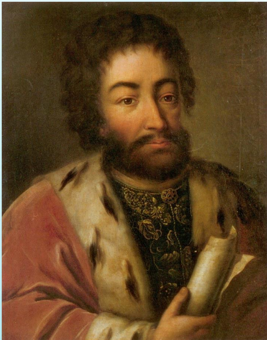
Никита Иванович Одоевский