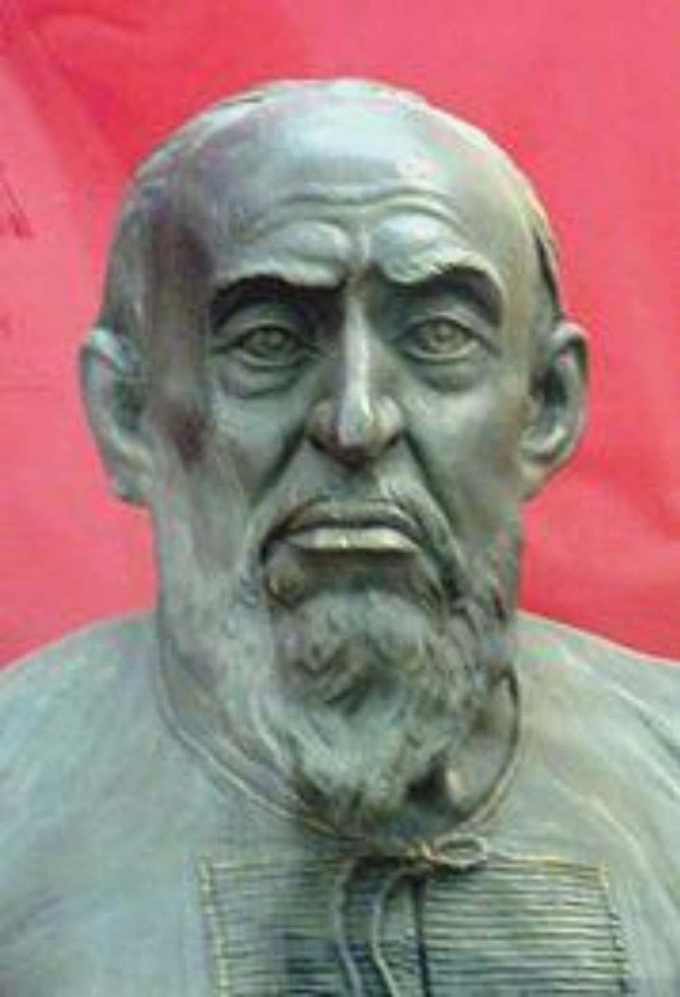
Иван IV Грозный (1533 - 1584)