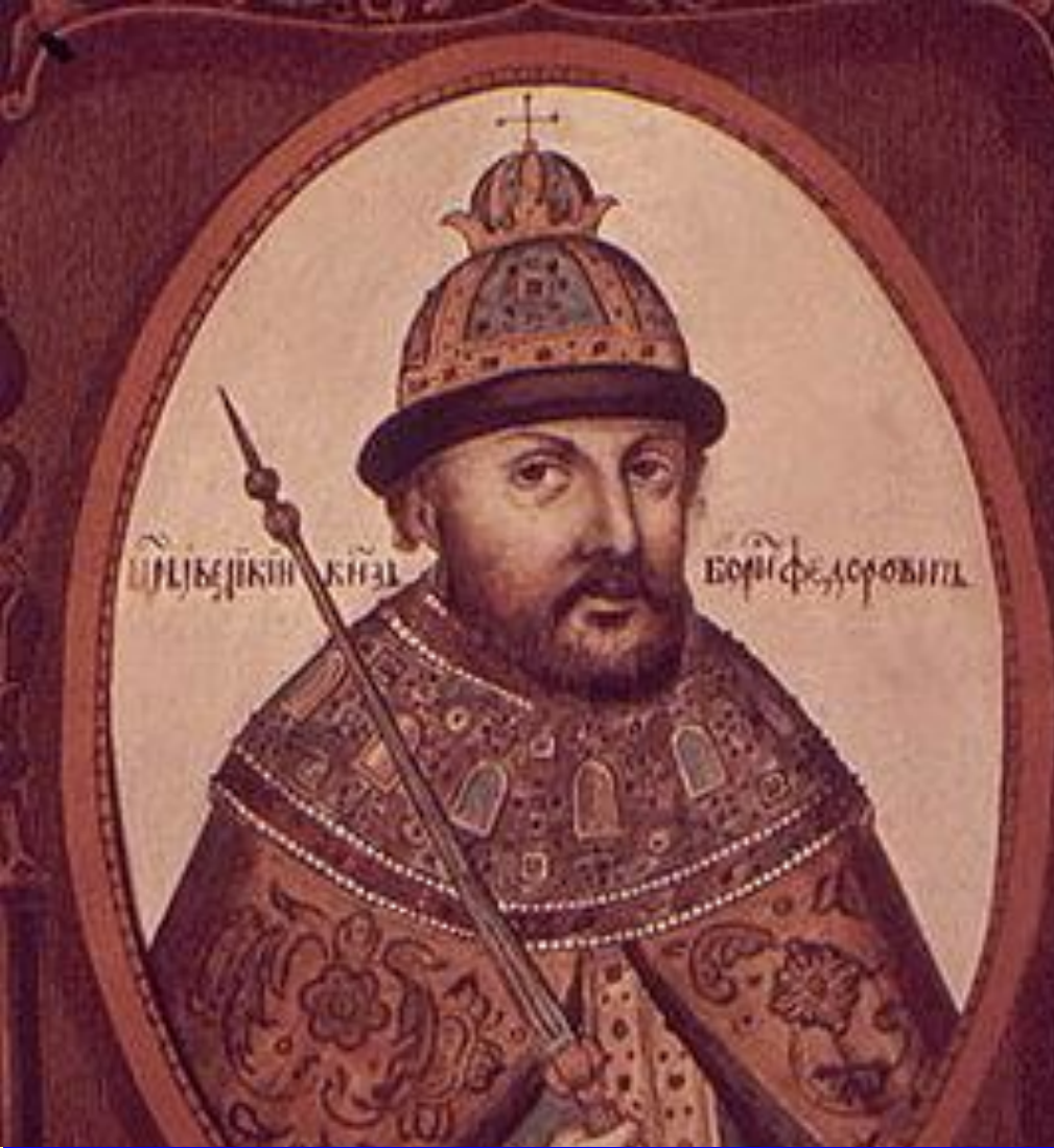
Борис Годунов ПРАВИТЕЛЬ