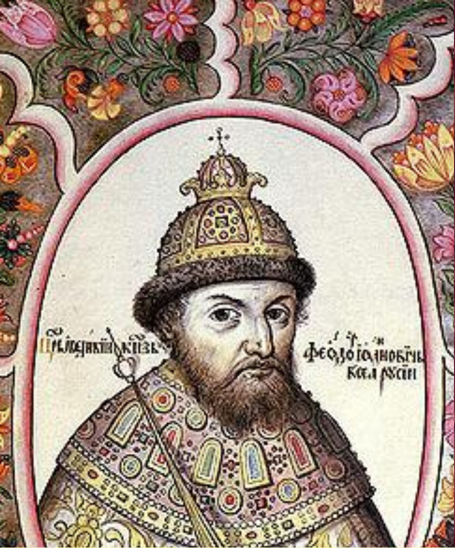
Федор Иванович (1584 - 1598) ЦАРЬ