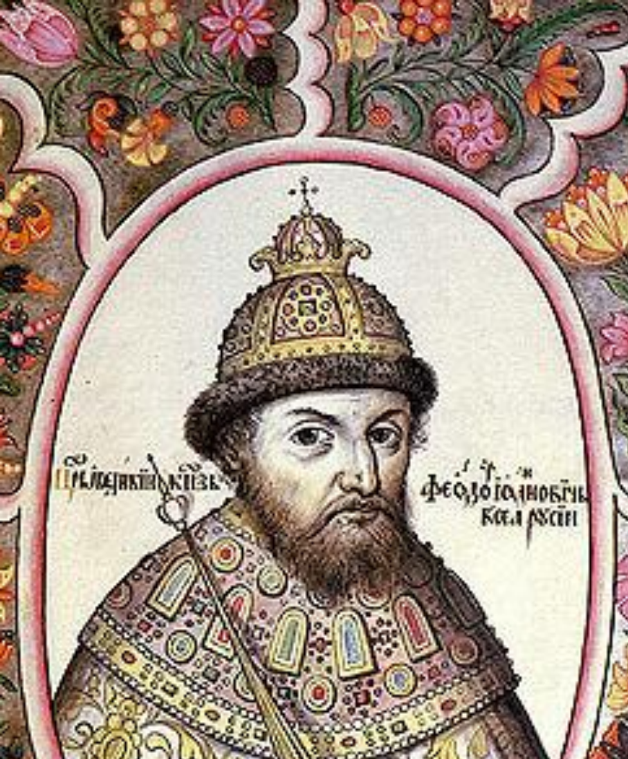
Федор Иванович (1584 - 1598) ЦАРЬ