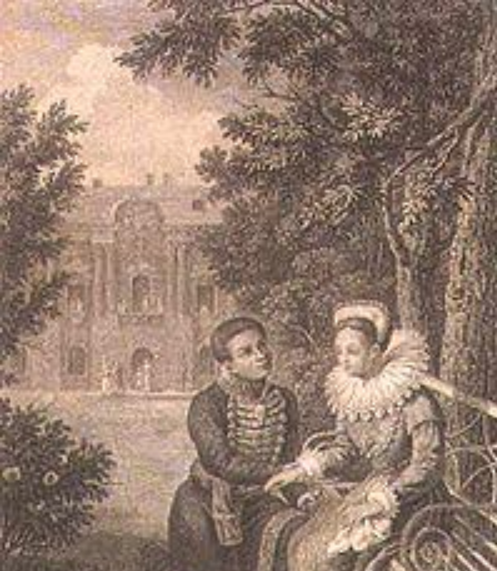
Лжедмитрий I и Марина Мнишек