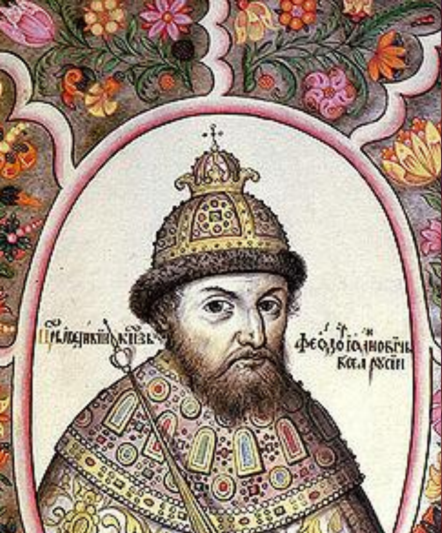
Федор Иванович (1584 - 1598) ЦАРЬ