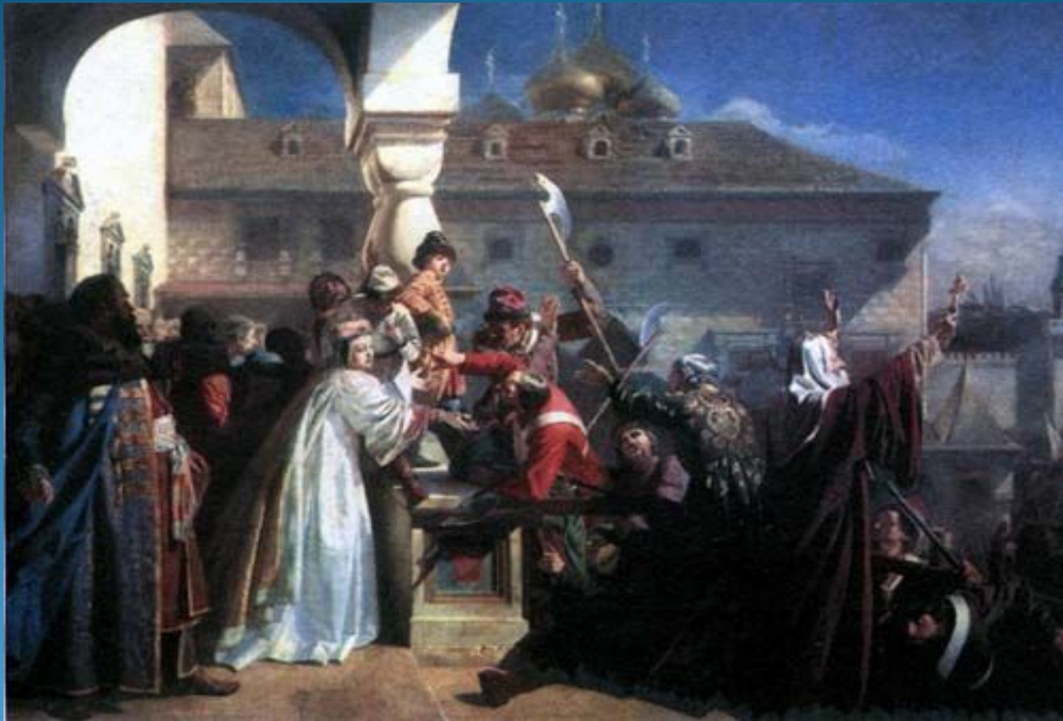
Наталья Кирилловна Нарышкина с царём Петром и царевичем Иваном перед стрельцами