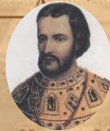
Иоанн V Алексеевич