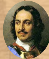
Петр I Алексеевич