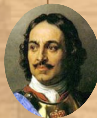
Петр I Алексеевич