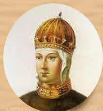
Мария Ильинична Милославская