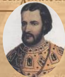
Иоанн V Алексеевич