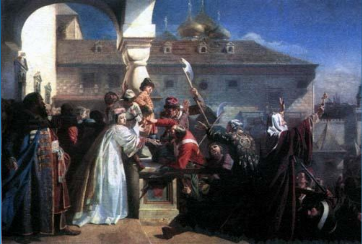
Наталья Кирилловна Нарышкина с царём Петром и царевичем Иваном перед стрельцами