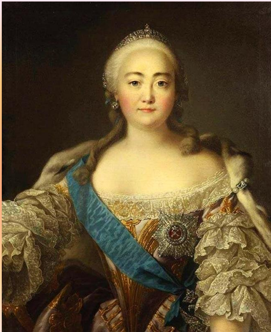
Елизавета Петровна Романова – императрица Елизавета I.