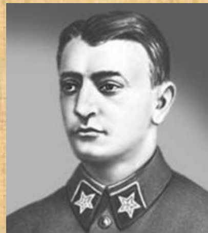
ТУХАЧЕВСКИЙ Михаил Николаевич