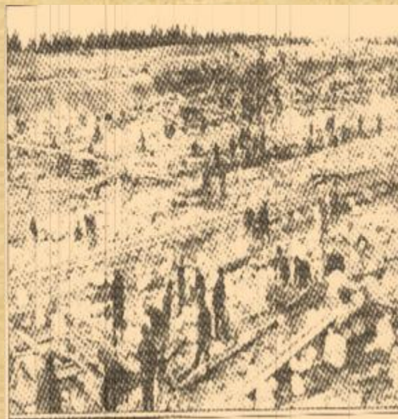
Заключенные на строительстве Беломорско- Балтийского канала