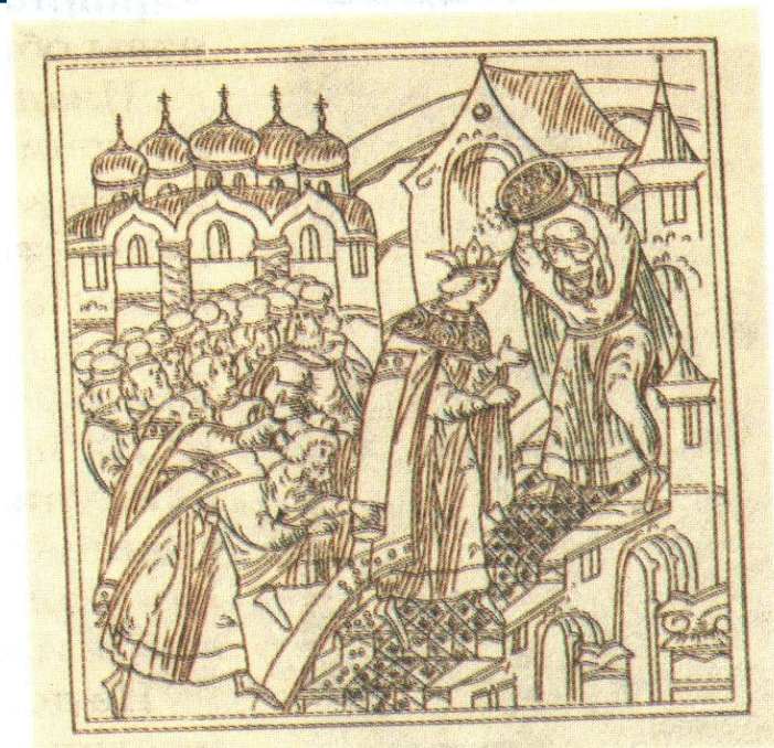
Обряд осыпания золотыми монетами царя Ивана IV после венчания на царство. Миниатюра.