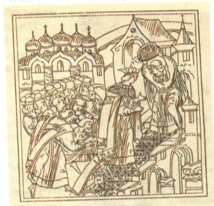
Обряд осыпания золотыми монетами царя Ивана IV после венчания на царство. Миниатюра.