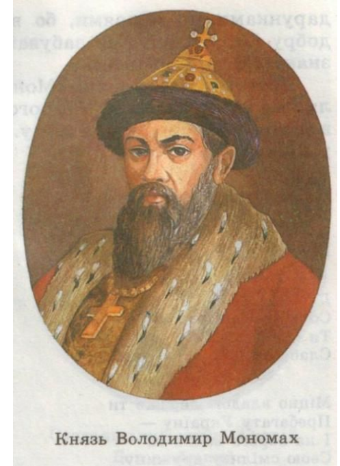
Князь Володимир Мономах