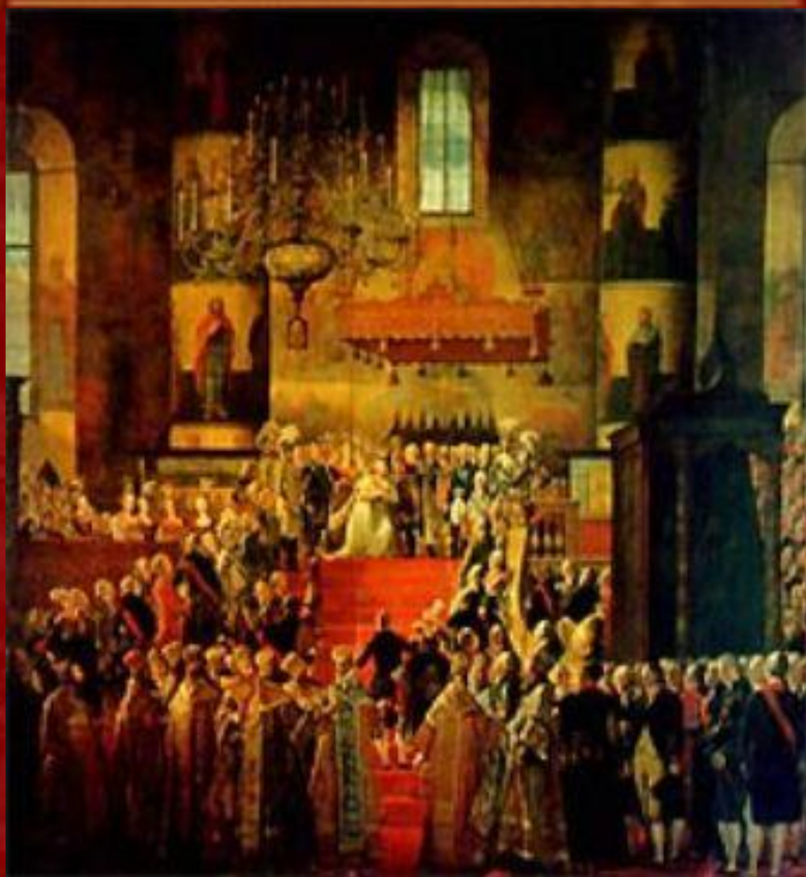
"Коронация Павла I и Марии Федоровны" кисти М.-Ф. Квадаля