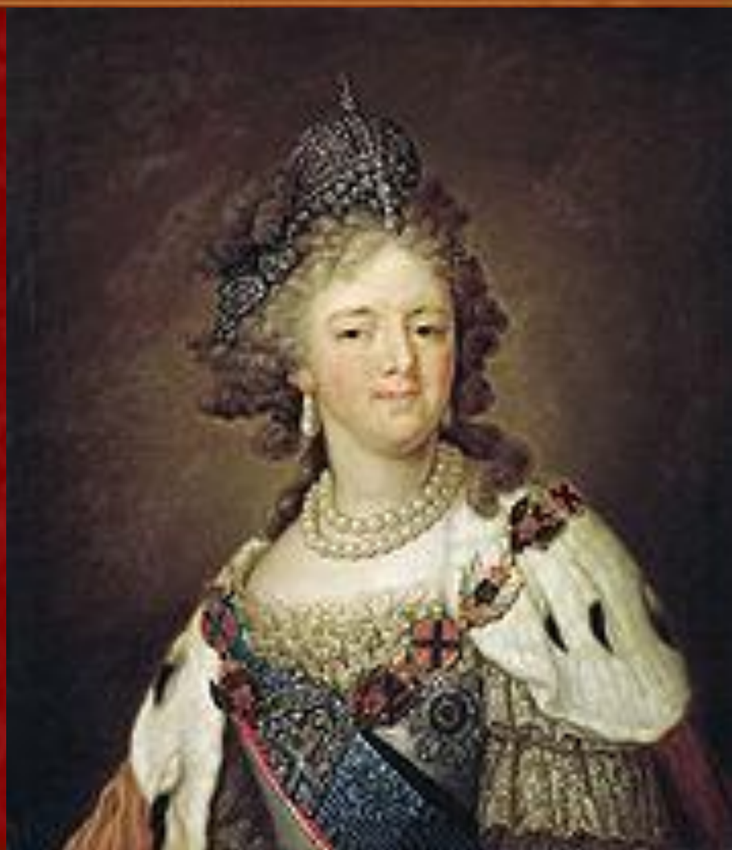
Доротея Вюртембергская — императрица Мария