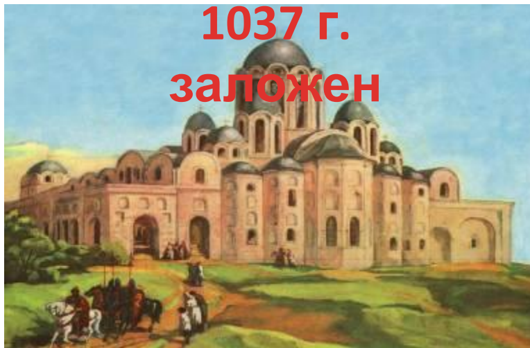
Тринадцатиглавый собор Святой Софии в

На Руси развивалось образование, культура, грамотность.