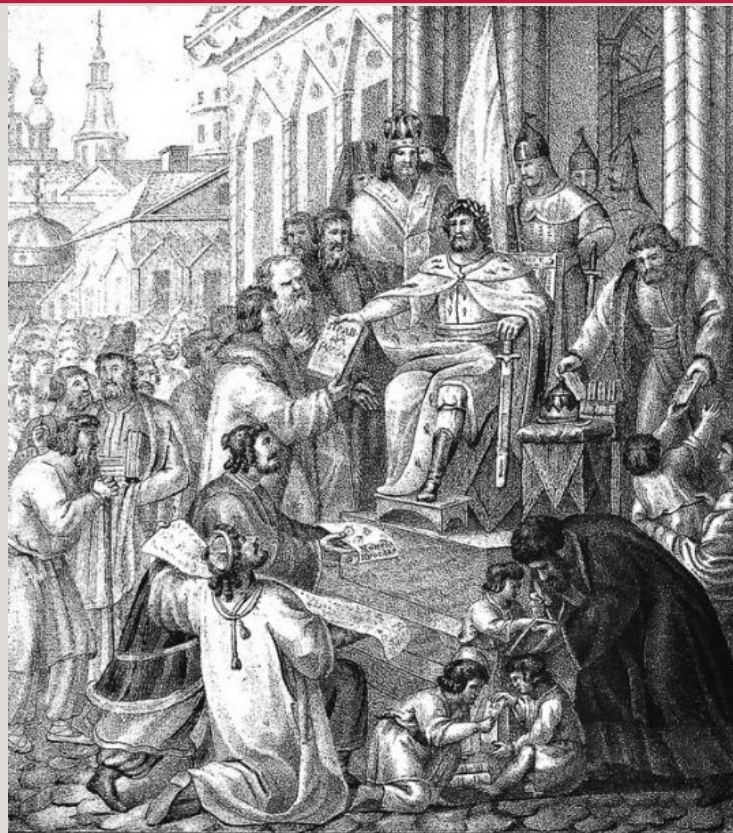
ЯРОСЛАВЪ ЗАКОНОДАТЕЛЬ 1019-1054

Ярославъ издасть письменные законы, подъ названіемъ Русской правды.