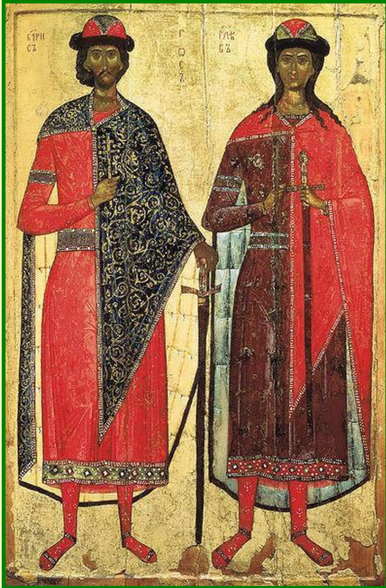
Борис и Глеб

Борис принял решение не бороться за власть в Киеве и распустил дружину. 24 июля 1015 г. он был убит на реке Альте.