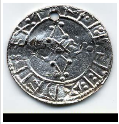
Западно- европейские монеты

С течением веков набрала силу торговля. В XI - XII вв. в русских городах купечество составляло значительную часть населения. Существовали целые районы, где жили торговцы из Хазарии, Польши, Скандинавских стран, германских земель. Немало в русских городах было торговцев из Волжской Булгарии, стран Востока - Персии, Хорезма. И русские купцы были желанными гостями на рынках Византии, Польши, германии. В Константинополе существовал Русский двор, где постоянно останавливались торговцы из Руси.