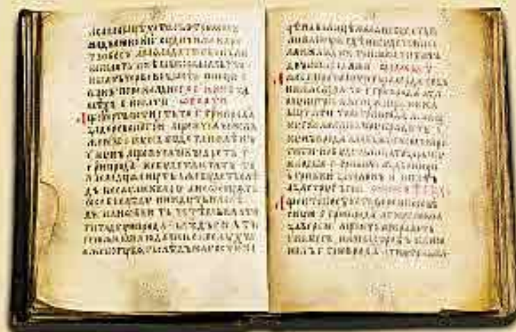
Русская правда. Рукопись XIV в.

Русская Правда Старейший древнерусский свод законов — Русская "Правда". Этот документ создавался на протяжении XI—XII веков. Начало ему около 1016 года положил Ярослав Мудрый (это прозвище появилось в исторической литературе в XIX веке). Во второй половине XI века сыновья Ярослава дополнили Русскую Правду новыми законами.