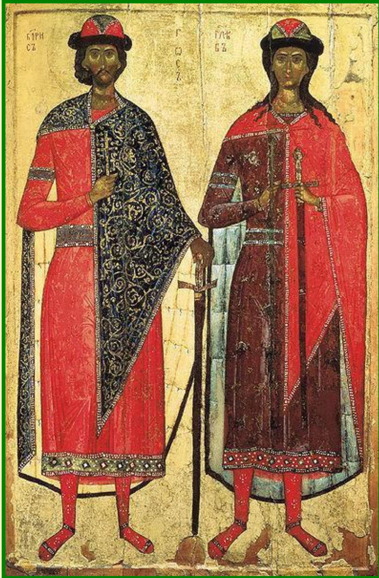
Борис и Глеб

Борис принял решение не бороться за власть в Киеве и распустил дружину. 24 июля 1015 г. он был убит на реке Альте.