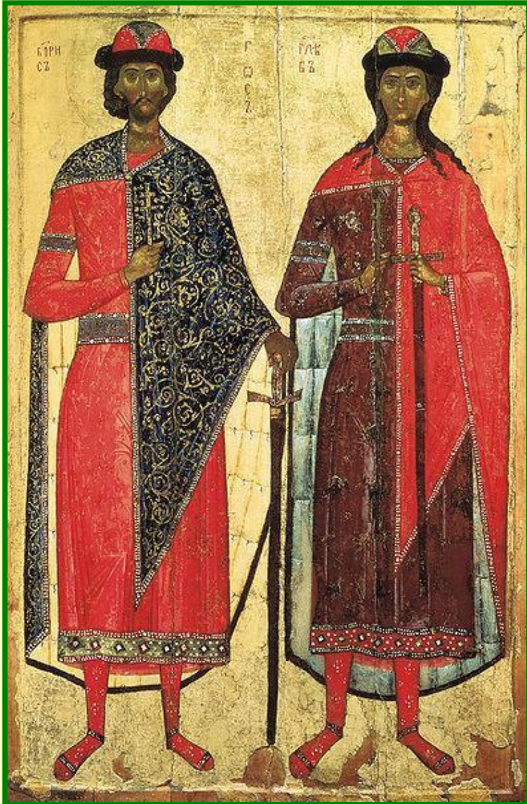
Борис и Глеб

Борис принял решение не бороться за власть в Киеве и распустил дружину. 24 июля 1015 г. он был убит на реке Альте.