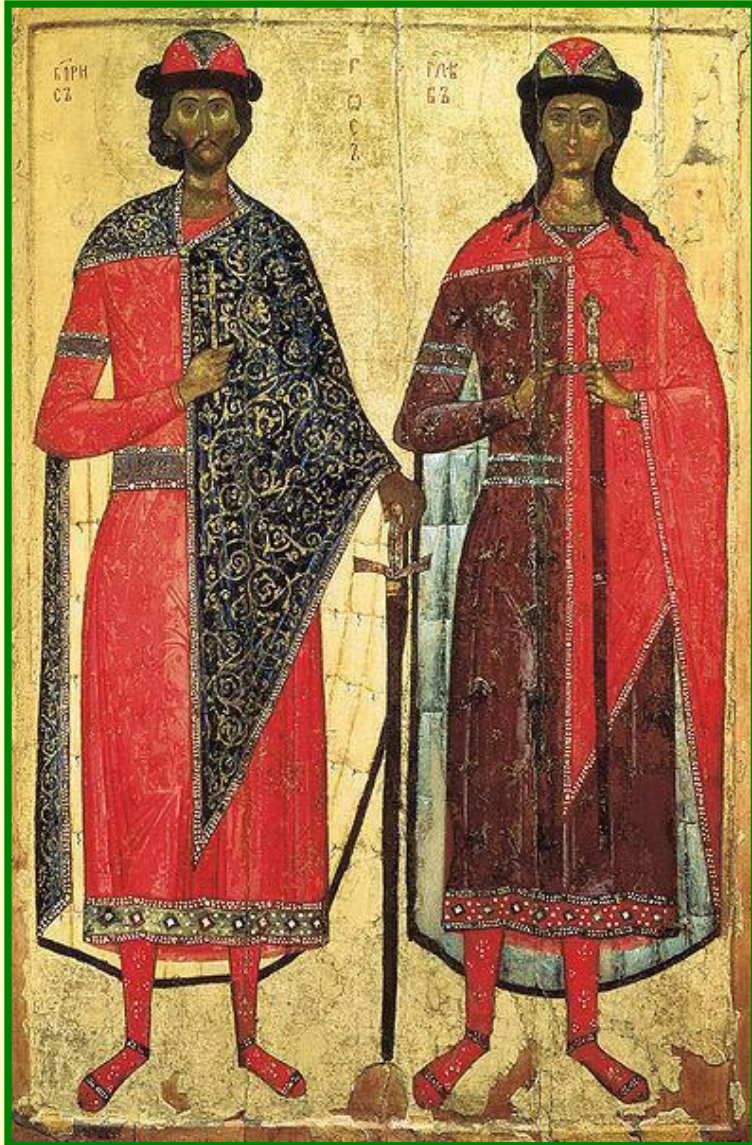
Борис и Глеб

Борис принял решение не бороться за власть в Киеве и распустил дружину. 24 июля 1015 г. он был убит на реке Альте.