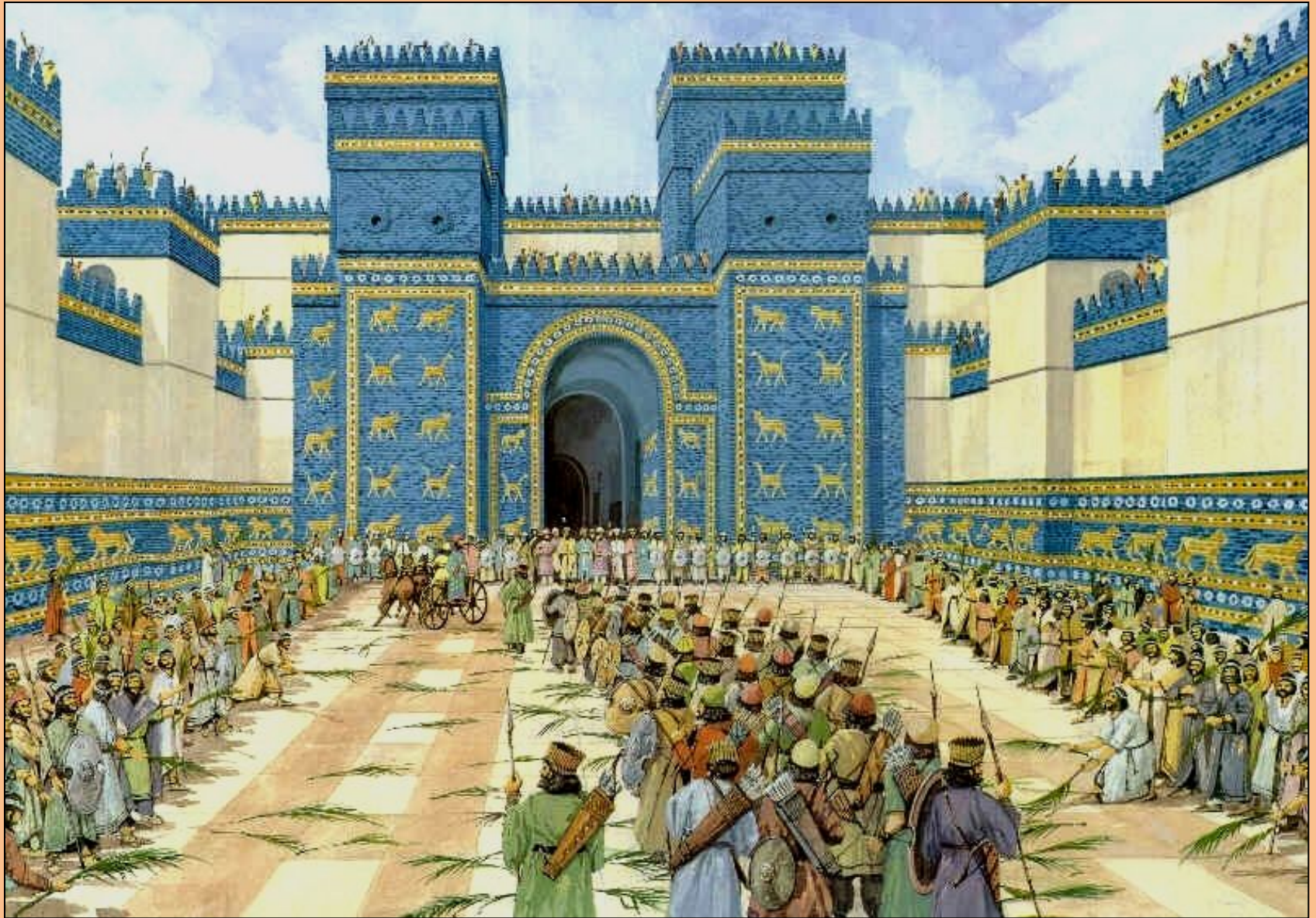
Ворота Богини Иштар