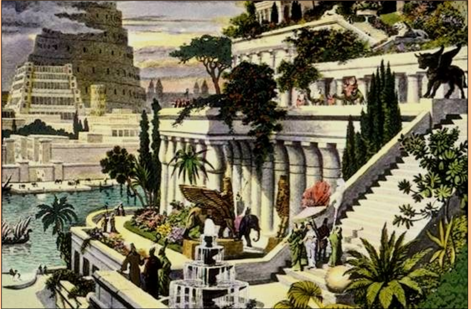
Висячие сады царицы Семирамиды, жены царя Навуходоносора