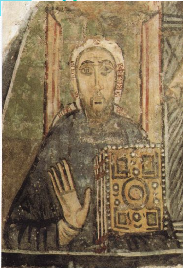
Святой Кирилл. Фреска церкви Святого Климента. IX в. Рим

Родиной братьев Константина (так звали святого Кирилла до принятия им монашества) и Мефодия была Македонская область Византии, а именно главный город области — Фессалоники, или по-славянски Солунь. Отец будущих просветителей славянских народов принадлежал к высшему слою византийского общества. Мефодий был старшим, а Константин младшим из семи его сыновей. Год рождения каждого из братьев точно неизвестен. Исследователи относят год рождения Мефодия ко второму десятилетию IX века.