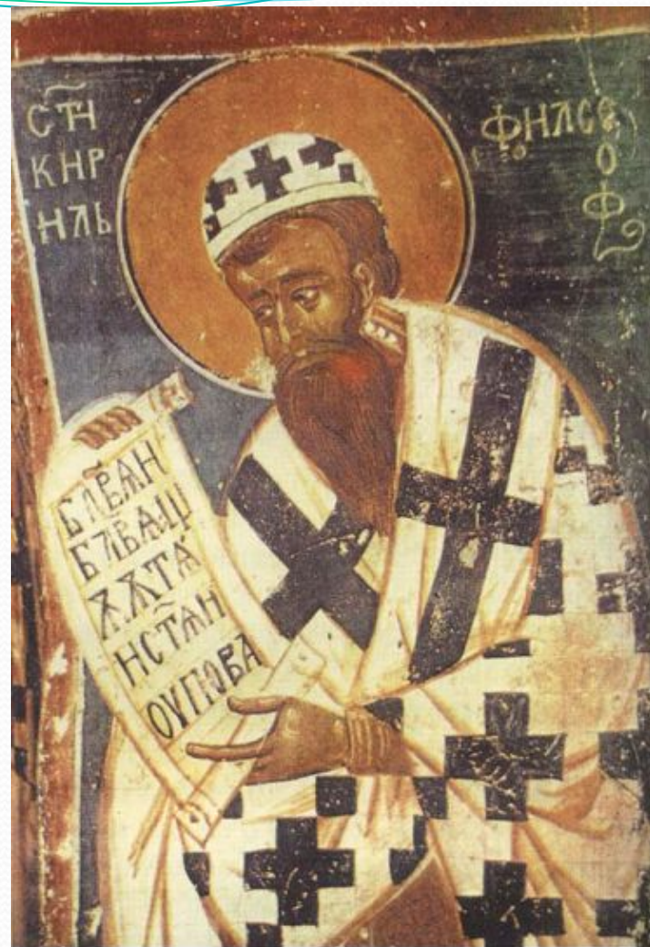
Святой Кирилл. Фреска церкви Апостола Петра. XIII в. Болгария

В Житии Константина о его образовании сообщается: «За три месяца он изучил всю грамматику и взялся за другие науки. Изучил Гомера, геометрию и у Льва и Фотия изучал диалектику и другие философские учения, кроме того — риторику, арифметику, астрономию, музыку и другие эллинские науки. И так он изучил все это, как не изучал ЭТИХ НАУК НИКТО ДРУГОЙ»