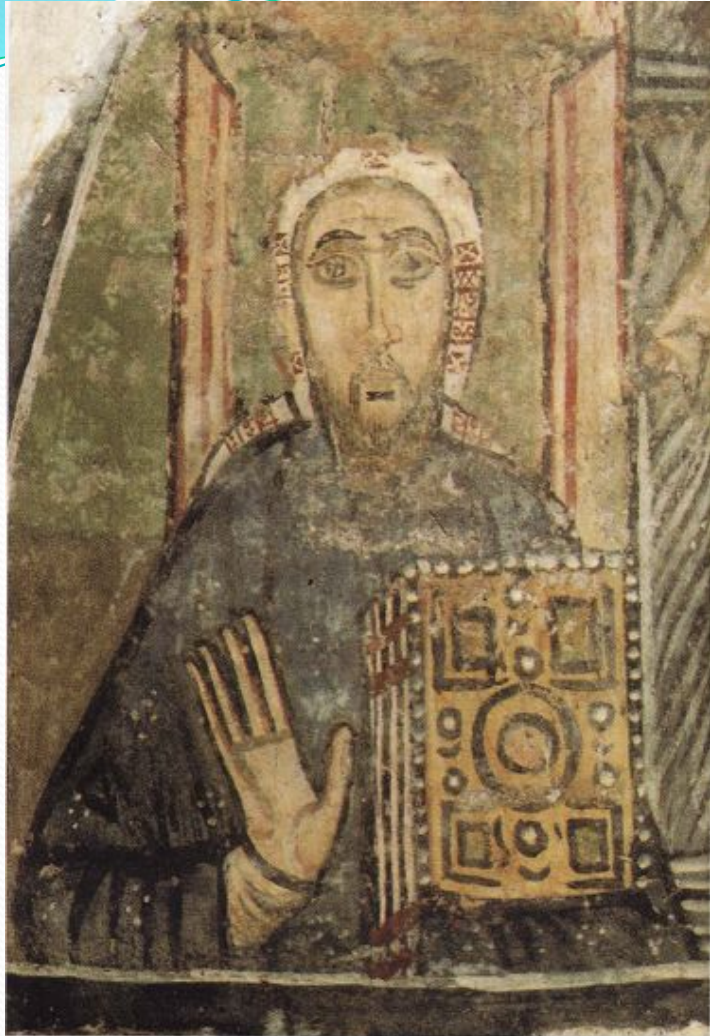
Святой Кирилл. Фреска церкви Святого Климента. IX в. Рим

Родиной братьев Константина (так звали святого Кирилла до принятия им монашества) и Мефодия была Македонская область Византии, а именно главный город области — Фессалоники, или по-славянски Солунь. Отец будущих просветителей славянских народов принадлежал к высшему слою византийского общества. Мефодий был старшим, а Константин младшим из семи его сыновей. Год рождения каждого из братьев точно неизвестен. Исследователи относят год рождения Мефодия ко второму десятилетию IX века.