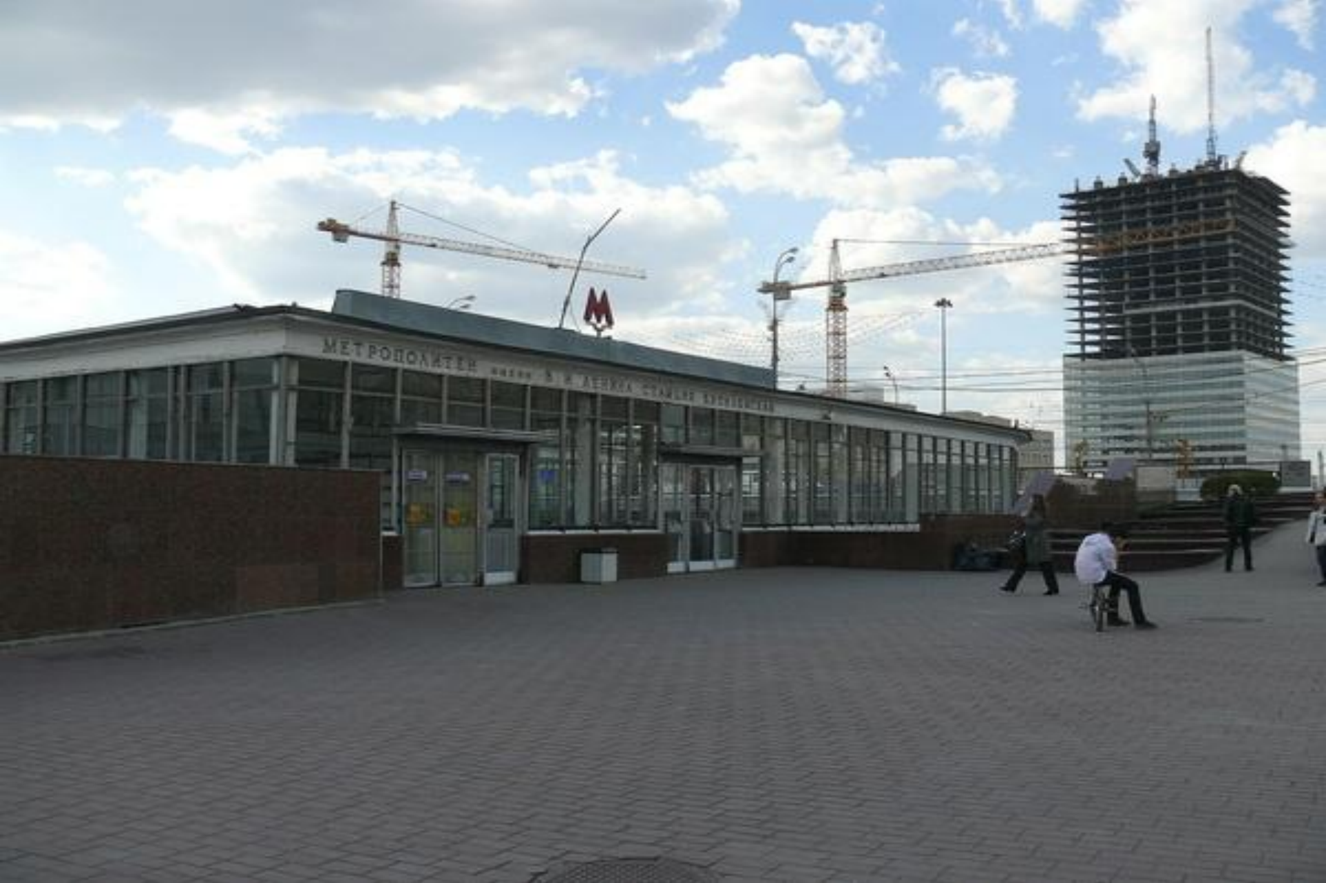
Метро станция «Кутузовский проспект»