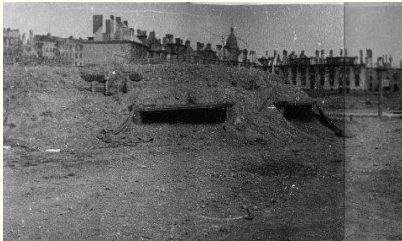
Фото 11 Штурм Кенигсберга. Интернет. Фото 12 Кенигсберг , немецкий ДЗОТ в районе Хорст Вессель парк. Интернет.

Особенно страшными были бои под Кенигсбергом , в Восточной Пруссии. Немцы укрепили 41 форт с подземными коммуникациями , вентиляцией , целыми армиями внутри и усиленной охраной снаружи.