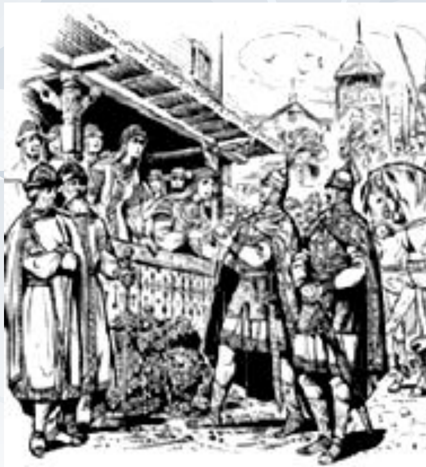
Аскольд и Дир в Киеве

А. был похоронен на горе Угорьской, Д. - у церкви св. Ирины.