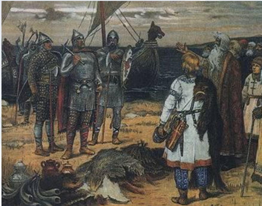
А. Васнецов «Призвание варяг»