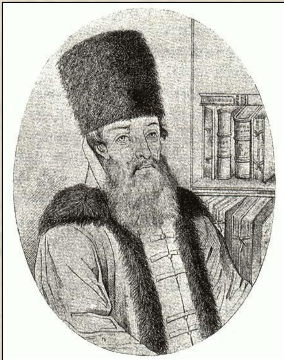
А.Л. Ордин- Нащокин