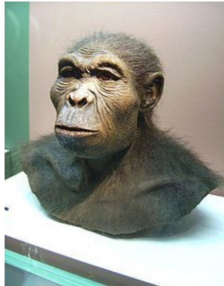
homo habilis – человек умелый