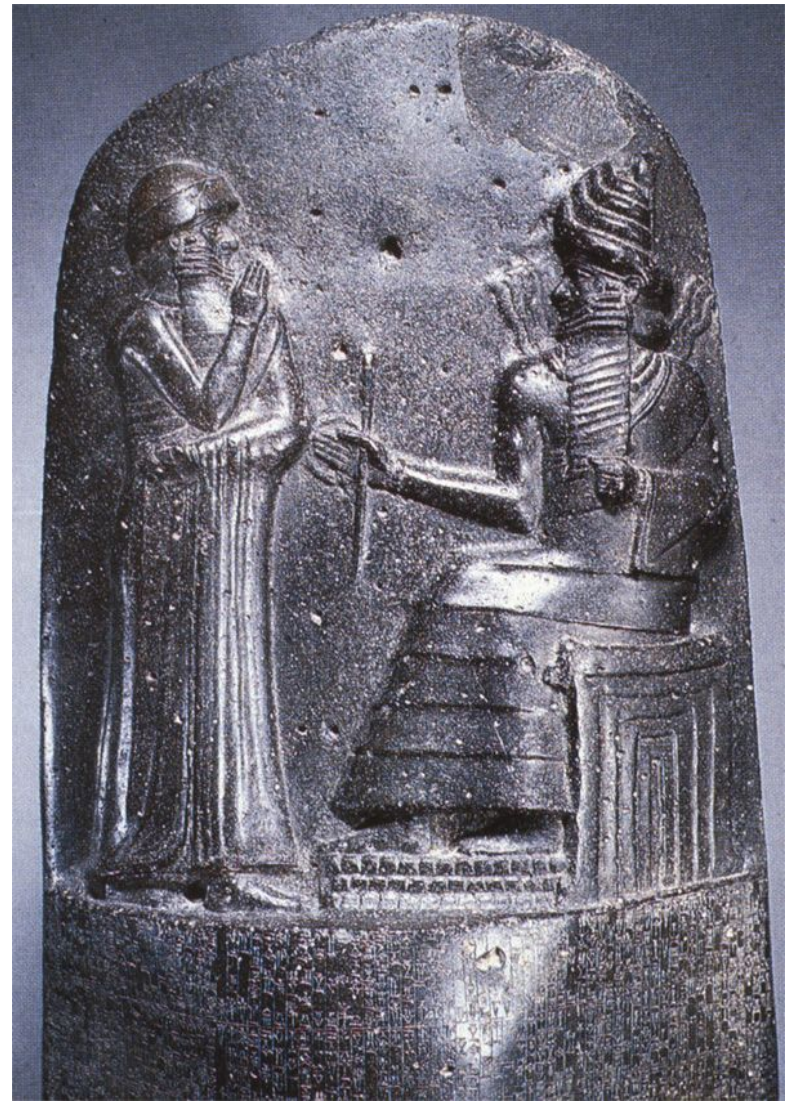
Верхняя часть стелы. Бог Солнца Шамаш вручает текст законов царю Хаммурапи