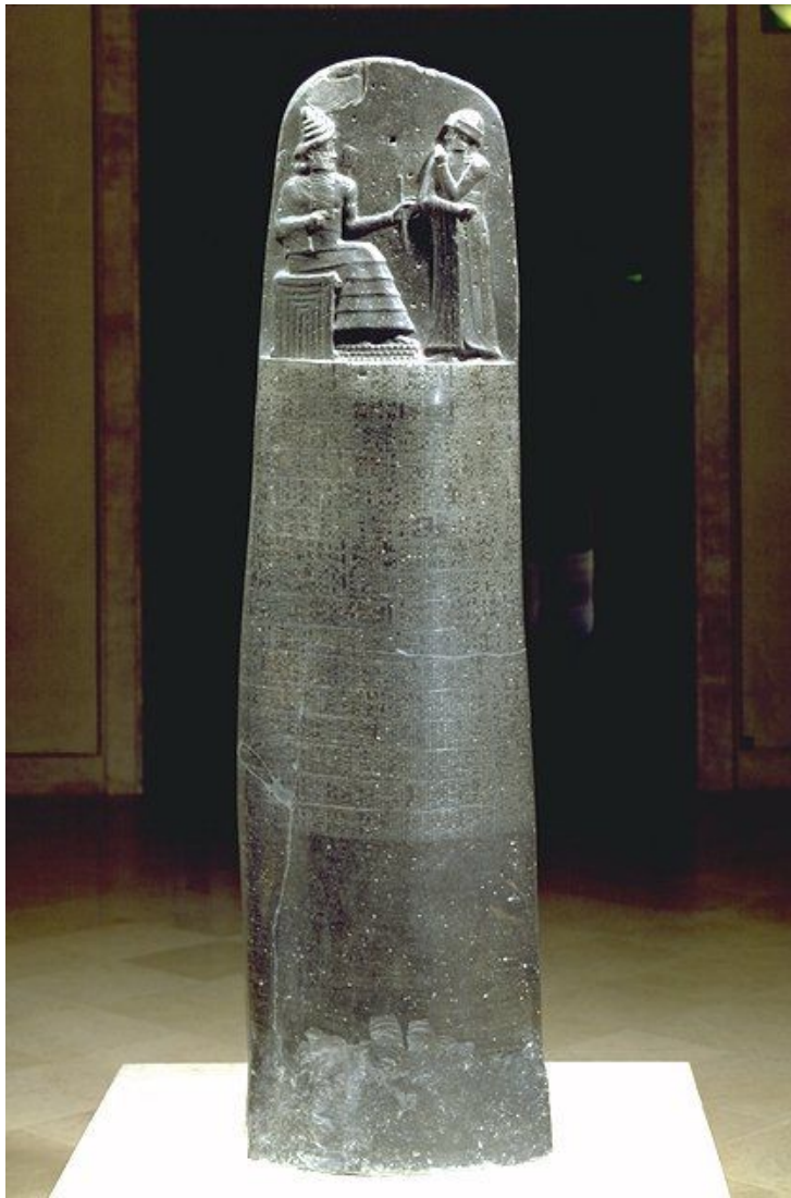
Законы Хаммурапи. Общий вид стелы