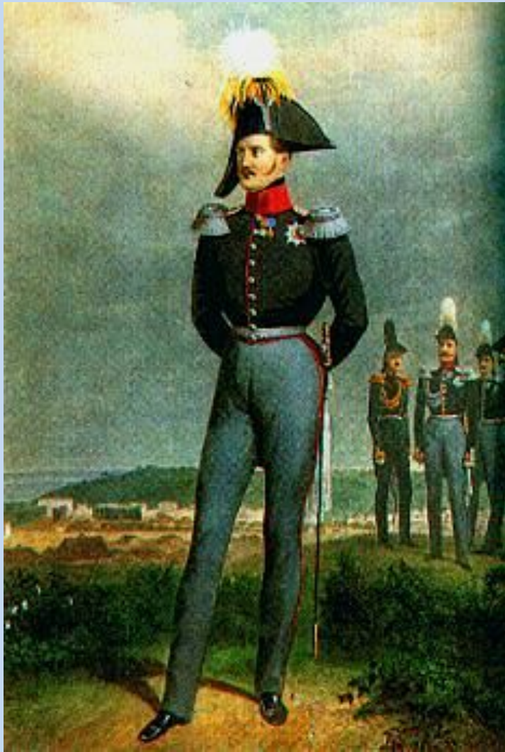
Николай I. Гравюра 19 в.

Порядок, который должен быть в государстве: