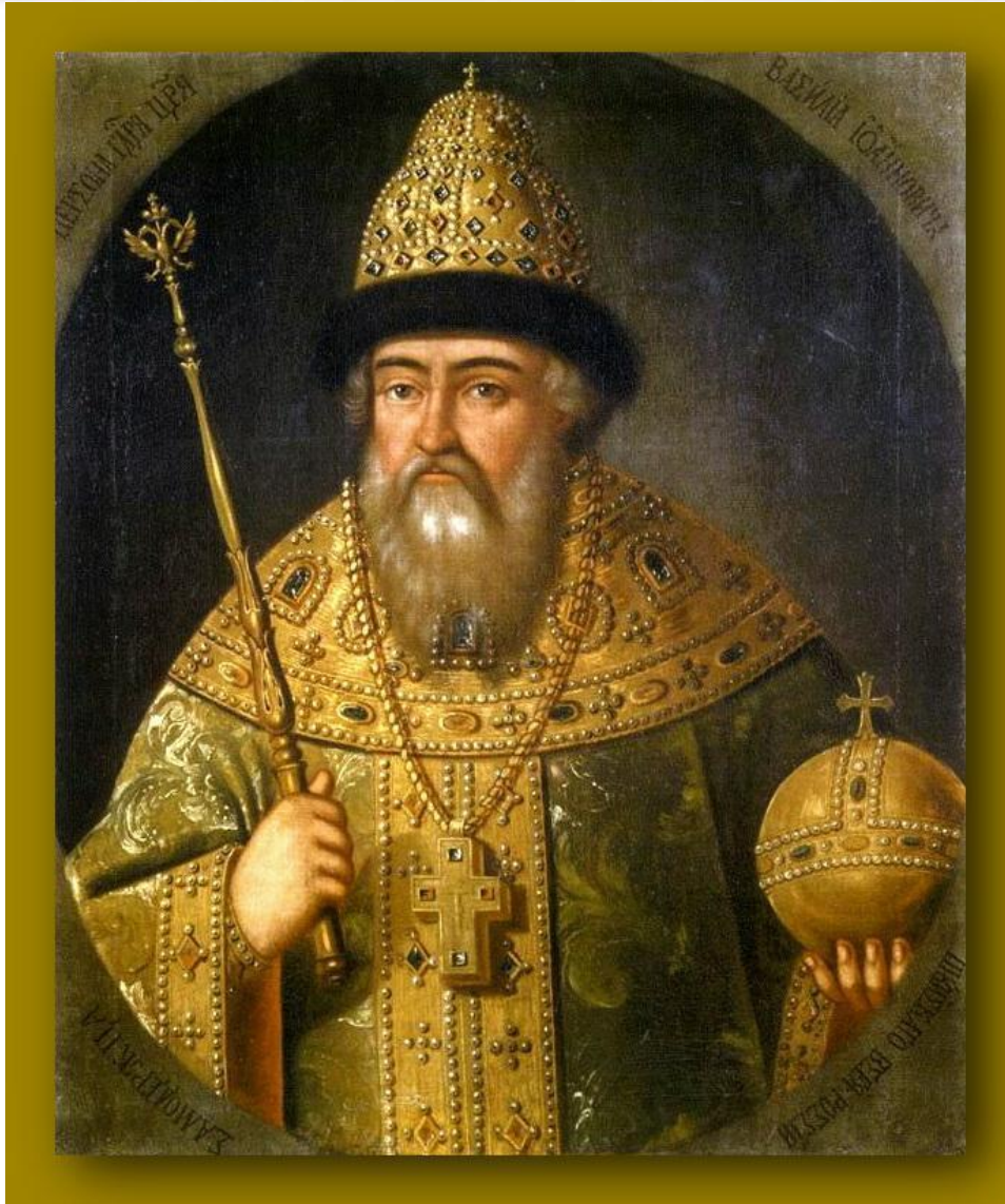
ВАСИЛИЙ ШУЙСКИЙ (1606-1610)