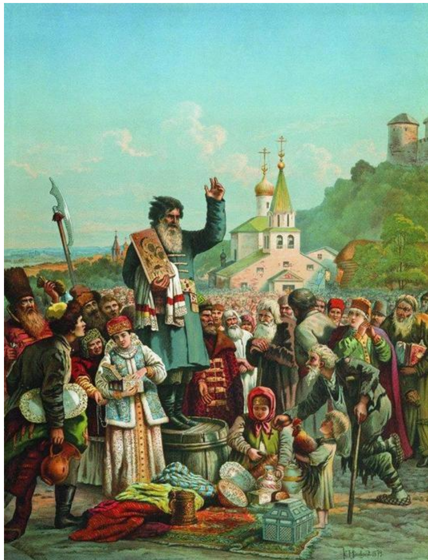
К.Е.Маковский. Возвание Кузьмы Минина к нижегородцам в 1611 году