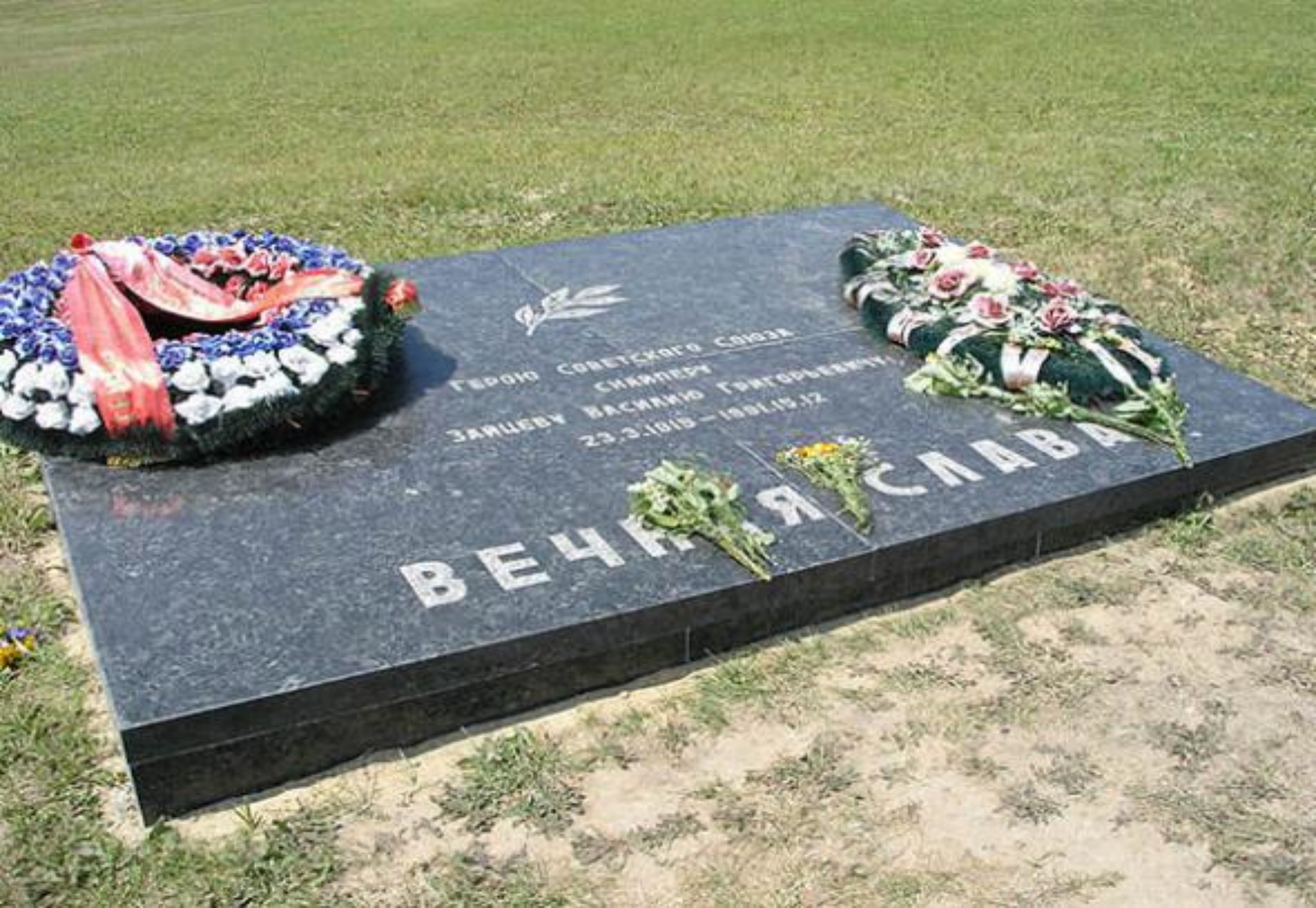
Похоронен на Мамаевом кургане