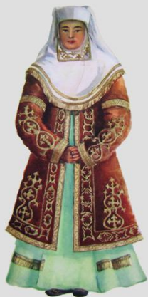
Полный костюм женщины. Начало XX в. Актебинская область.