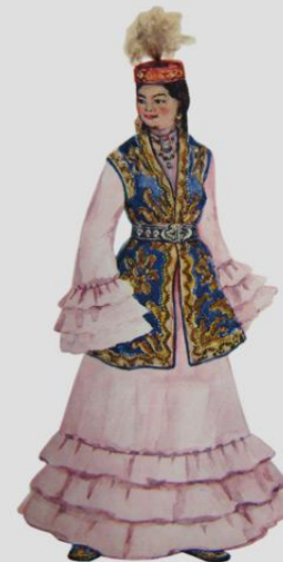
Костюм девушки. 1930 г. Северо-Казахстанская область