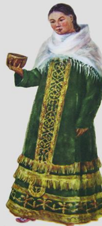
Койлік - платье девушки. Материал - бархат, вышито золотом. Начало XX в. Западно-Казахстанская область