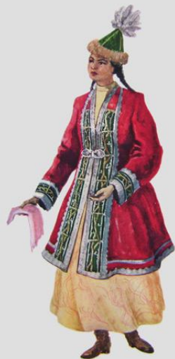
Костюм девушки. 20-е годы XX в. Актебинская область.