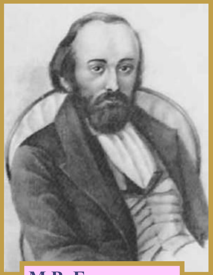
М.В. Буташевич- Петрашевский