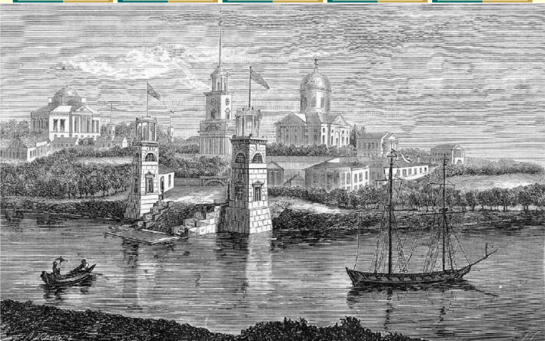
Общий вид села Грузина при графе Аракчееве. 1822 г. Литография Канашенкина по рис. Г. Глушкова