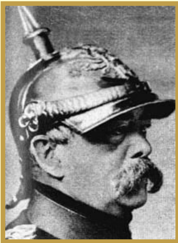
О. Фон Бисмарк