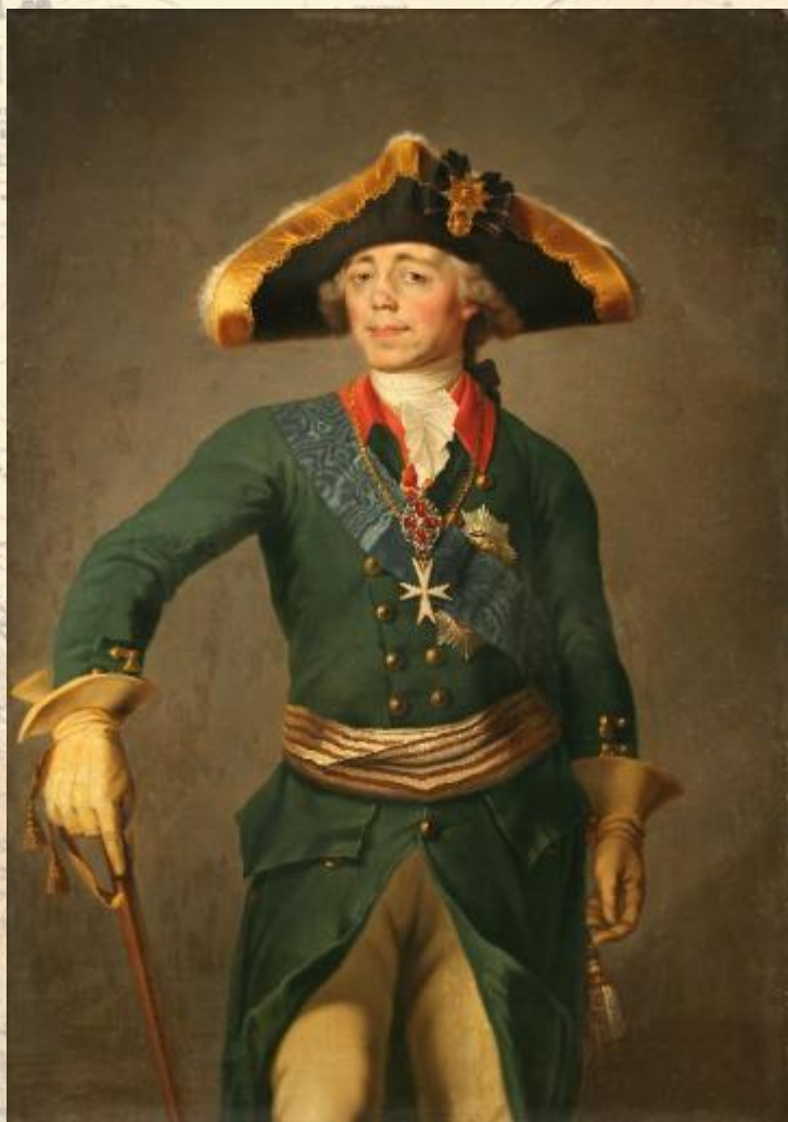
Отец – Павел I