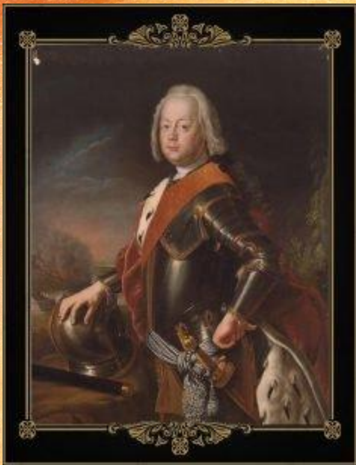
Христиан-Август — отец Екатерины II

2 мая 1729 года родилась девочка, названная при рождении София Фредерика Августа Ангальт-Цербстская.