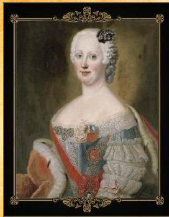
Иоганна-Елизавета — мать Екатерины II