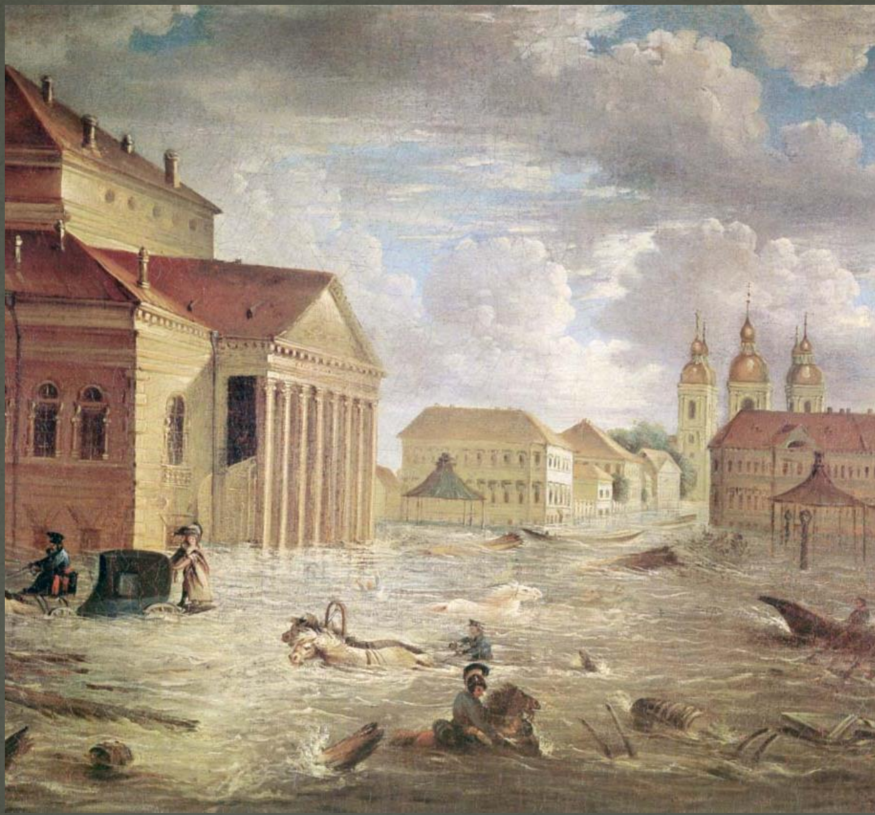
Наводнение в Санкт- Петербурге.