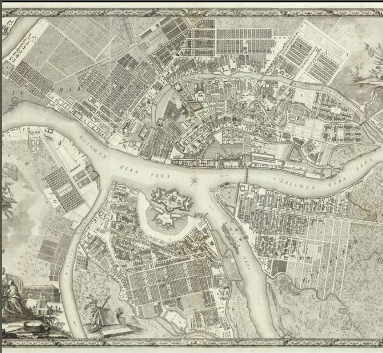
Карта Санкт-Петербурга в 1753 году