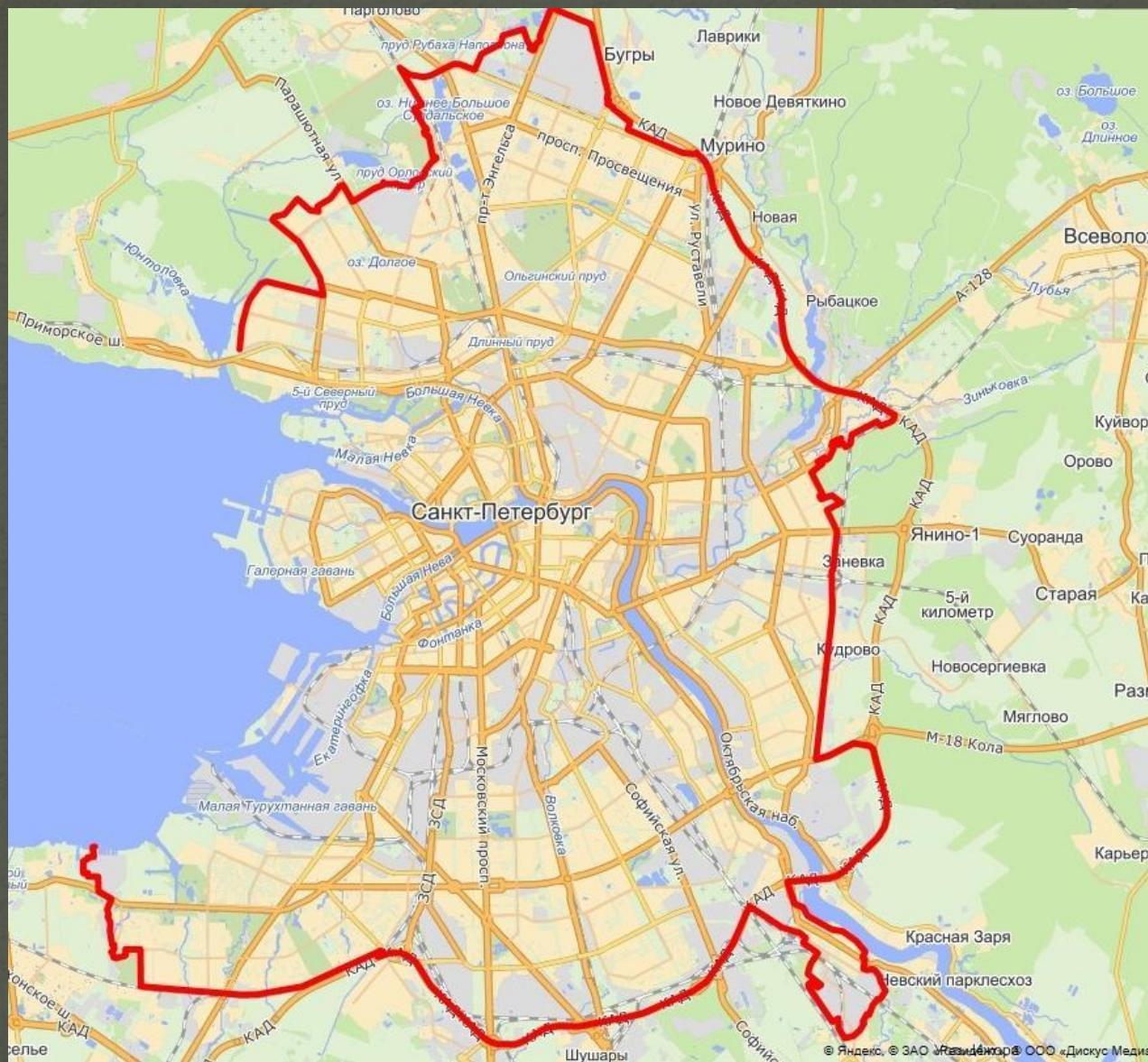
Санкт-Петербург карта 2017 года