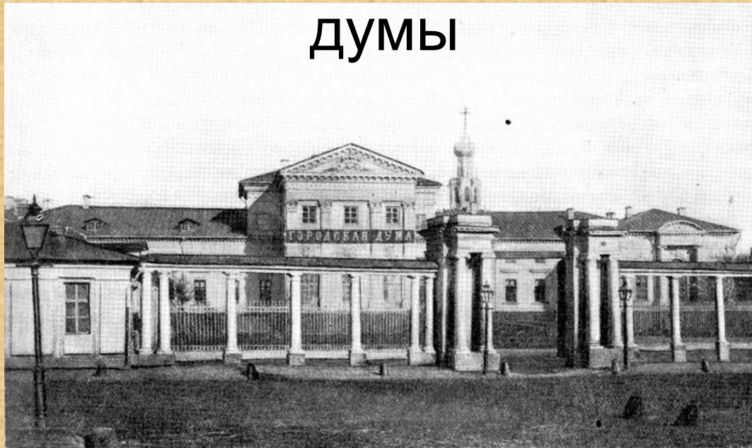
Старое здание городской Думы