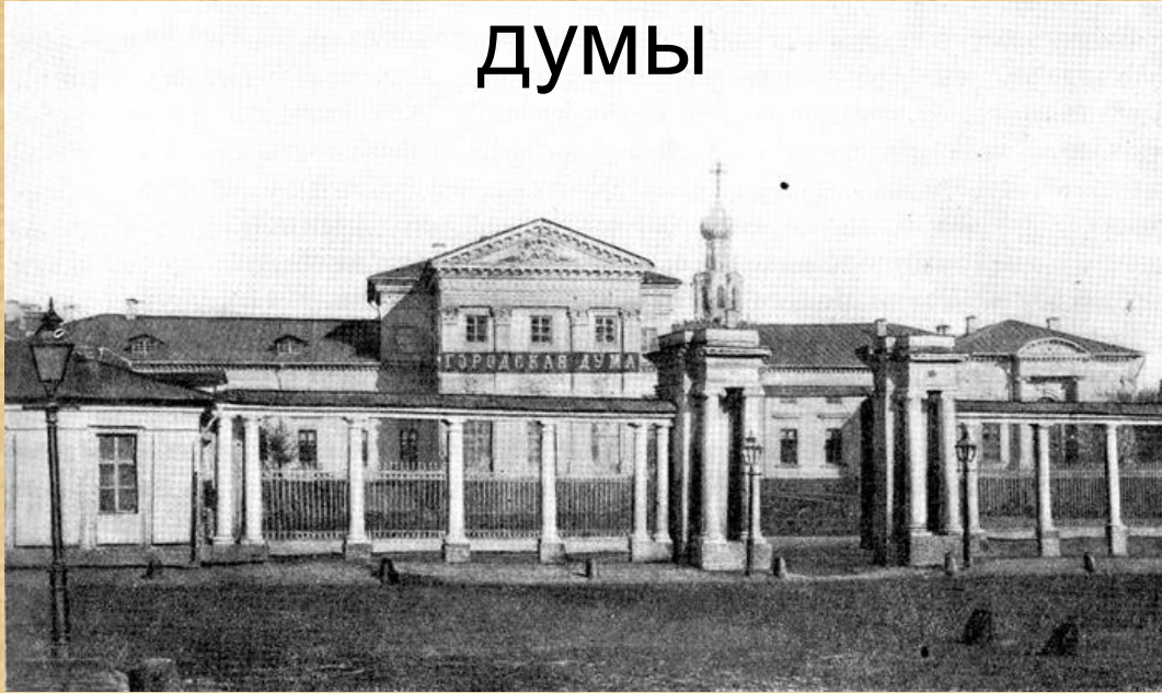
Старое здание городской Думы