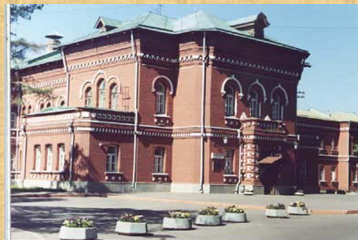
Психиатрическая больница № 1