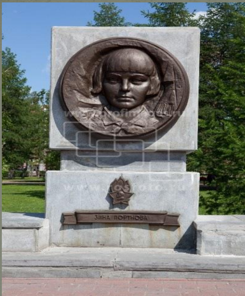
Челябинск. Парк "Алое поле". Аллея пионеров-героев. Зина Портнова