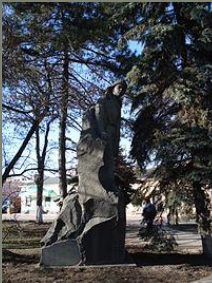
Памятник Владимиру Дубинину в г. Керчь