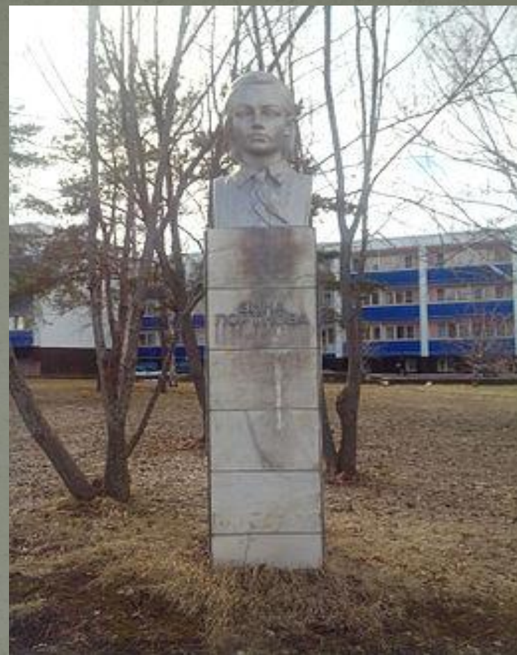
Памятник Зине Портновой на территории быв. пионер. лагеря «Алые паруса» в с. Ягодное близ Тольятти