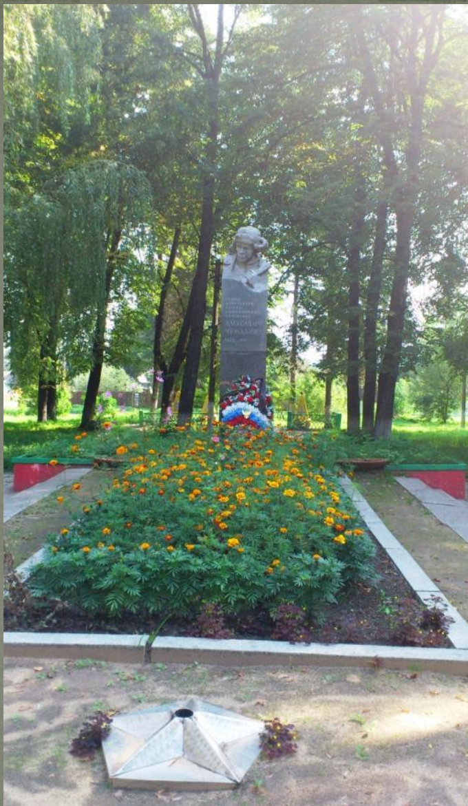
Памятник в г. Чекалин