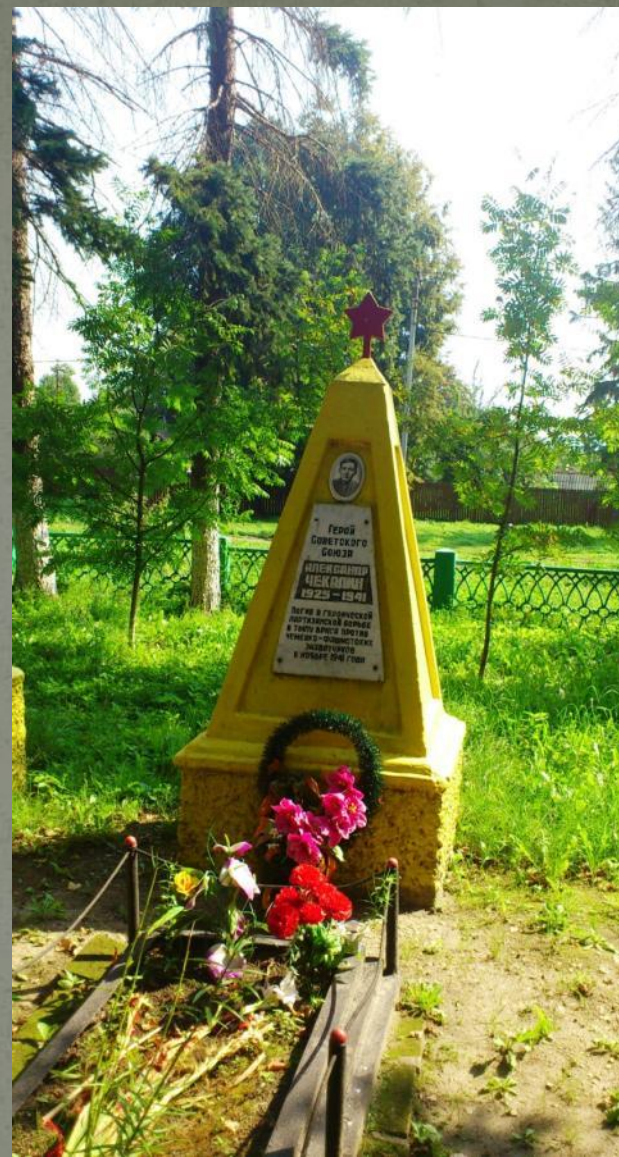
Могила в г. Чекалин