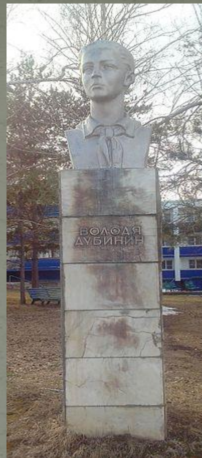
Памятник В. Дубинину на территории быв. пионер. лагеря «Алые паруса» в с. Ягодное близ Тольятти