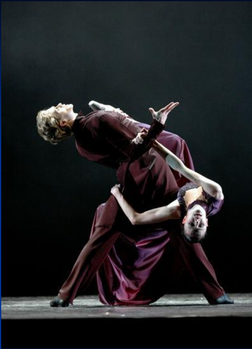
Балет “Анна Каренина”