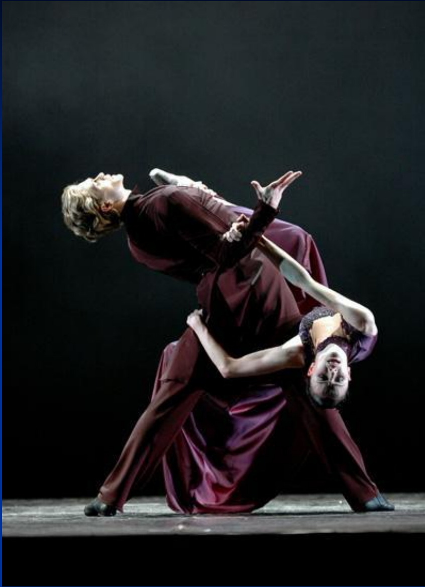
Балет “Анна Каренина”