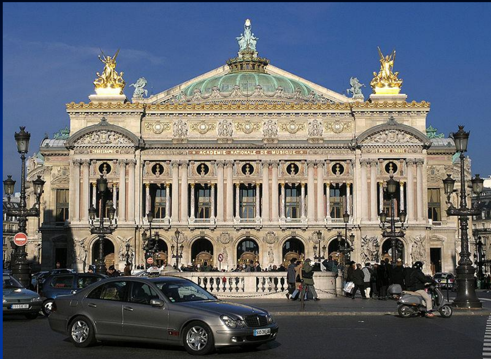
Гранд Опера в Париже