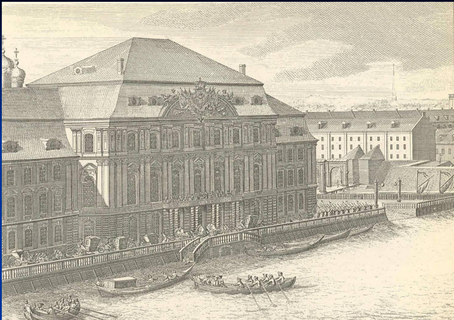
4-й Зимний дворец Анны Иоановны